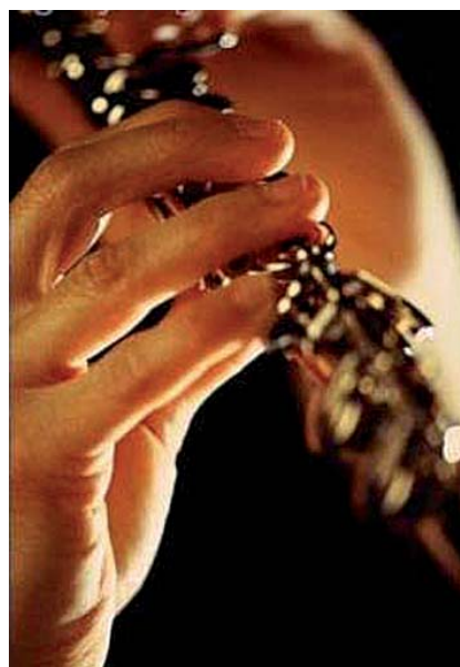
Figure 2. La main, rôle central dans la pratique instrumentale

La justification de la place du physiothérapeute a également été étoffée par la mise en avant de certaines lacunes dans les prises en charge actuelles, démontrée par le récit de leurs parcours professionnels parfois chaotiques, dus